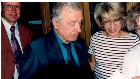
Rycina 5. Goście ze Szwecji w Klinice Dermatologicznej w Gdańsku (1994 rok)